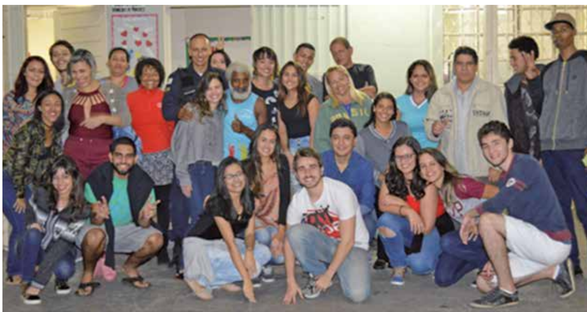
Figura 3 - Estudantes da FJP e alunos da Escola Municipal Dora Tomich Laender- Projeto -Fica Ativo Cidadania em 2017

Nos últimos anos, a extensão universitária tem se consolidado na Escola de Governo principalmente pela compreensão de seu crucial papel na proposta de uma formação de administradores com fundamentos teóricos sólidos, mas altamente sensíveis à realidade, a fim de que estes novos profissionais encontrem-se preparados para respeitar e valorizar as características individuais e sócio-comunitárias, possibilitando novas oportunidades àqueles que, por diversos motivos, não foram ainda contemplados pelas políticas públicas. Os projetos da Escola de Governo