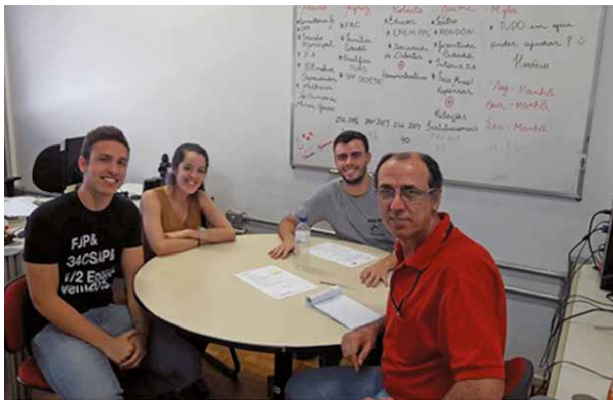
Figura 1 - Estudantes da FJP e professor da Gerência de Extensão em reunião de planejamento de atividades para a imersão municipal.

Os projetos de aperfeiçoamento profissional/acadêmico são iniciativas que, pela natureza de suas atividades, incentivam a pesquisa e o desempenho técnico. Uma dessas atividades é a