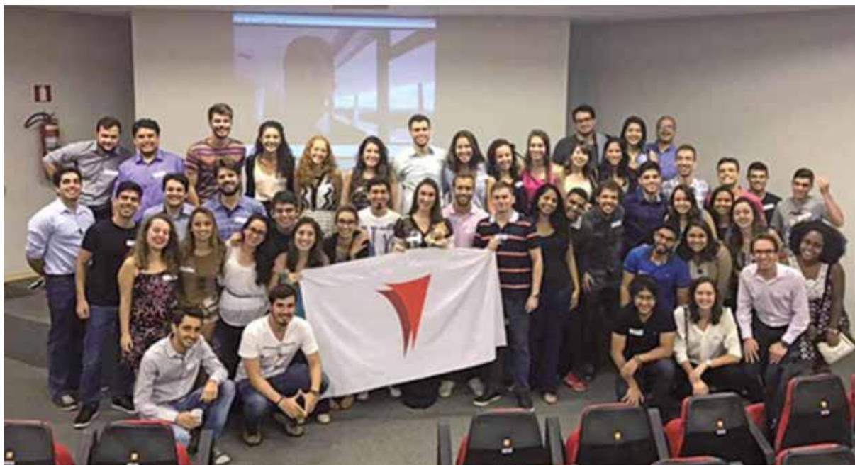
Figura 2 - Alunos participantes da Consultoria Júnior – março de 2017

Consultoria Júnior em Administração Pública 2 . Elaborada em conformidade com o conceito de empresa júnior, a João Pinheiro Júnior presta serviços de consultoria, assessoria e elaboração de projetos nas diversas áreas da gestão pública, atuando junto a órgãos das esferas municipal, estadual e federal. Os objetivos são desenvolver profissionais capazes de contribuir para a melhoria da administração pública, e proporcionar aprendizado e experiência extracurricular aos estudantes do curso de Administração Pública.