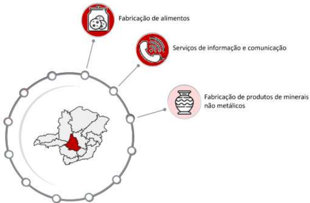
Figura 2: Setores-chave da RGInt de Divinópolis em 2016.